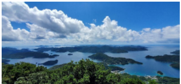
五島列島周辺のシーニック・クルージングイメージ