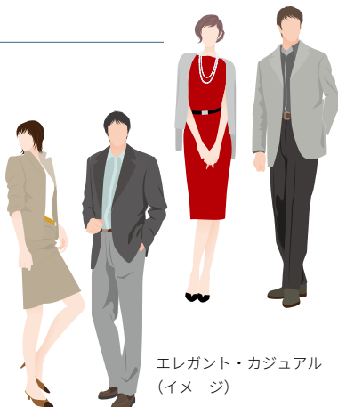
エレガント・カジュアル (イメージ)

※エレガント・カジュアルでは、ネクタイとジャケットは任意となりますが、ジーンズはご遠慮ください。