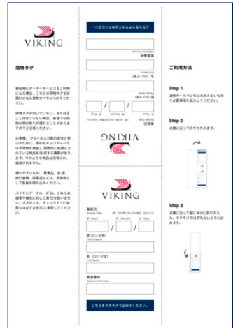
バゲージタグ(イメージ)

宅配サービスをご利用の場合も必ずタグを取れないように付けてから発送してください。